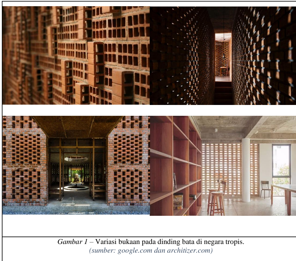
Gambar 1 – Variasi bukaan pada dinding bata di negara tropis.

sehingga dapat menciptakan susunan dinding yang kuat, efisiensi dan efektivitas konstruksi karena nyaris tidak membutuhkan perekat antar modul bata, dan akurasi ukuran batu bata.