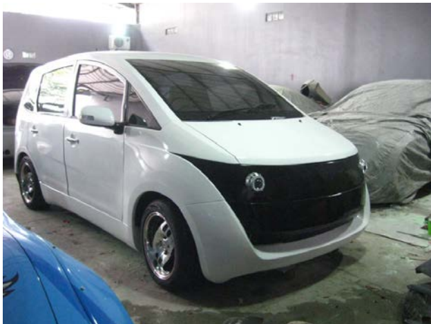
Gambar I.1 Eksterior Mobil city car Listrik Generasi 2

Indonesia telah menjadi importir minyak bumi sejak tahun 2004 karena kebutuhan minyak melebihi kapasitas produksi minyak bumi sehingga pemborosan BBM akibat kemacetan tersebut menjadi beban ekonomi nasional ("Indonesia Crude Oil Production and Consumption by Year (Thousand Barrels per Day)," n.d.). Akibat dari pemborosan energi tersebut, ditambah dengan menipisnya cadangan minyak di Indonesia maka penelitian dan pengembangan sistem transportasi dengan energi alternatif seperti mobil listrik mulai digalakkan di berbagai lembaga penelitian maupun perguruan tinggi. Salah satu tindak lanjut kegiatan tersebut adalah dibentuknya konsorsium Mobil Listrik Nasional sebagai pengembang mobil listrik utama di Indonesia.