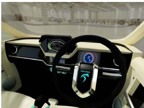
Gambar I.2 Render Interior City Car Listrik Generasi 2

Lembaga Ilmu Pengetahuan Indonesia (LIPI) merupakan salah satu anggota dari konsorsium tersebut dan saat ini sedang mengembangkan mobil listrik city car generasi kedua. City car generasi kedua merupakan penyempurnaan dari city car generasi pertama yang dikembangkan pada tahun 2005 dan diselesaikan pada tahun 2008 (Heri Sanjaya et al., 2008). Penyempurnaan city car generasi kedua meliputi bagian eksterior, interior, serta sistem penggerak. Eksterior serta sistem penggerak dari mobil listrik generasi kedua telah selesai dikerjakan. Eksterior dan Interior Mobil listrik generasi kedua dapat dilihat pada gambar I.1 dan gambar I.2.