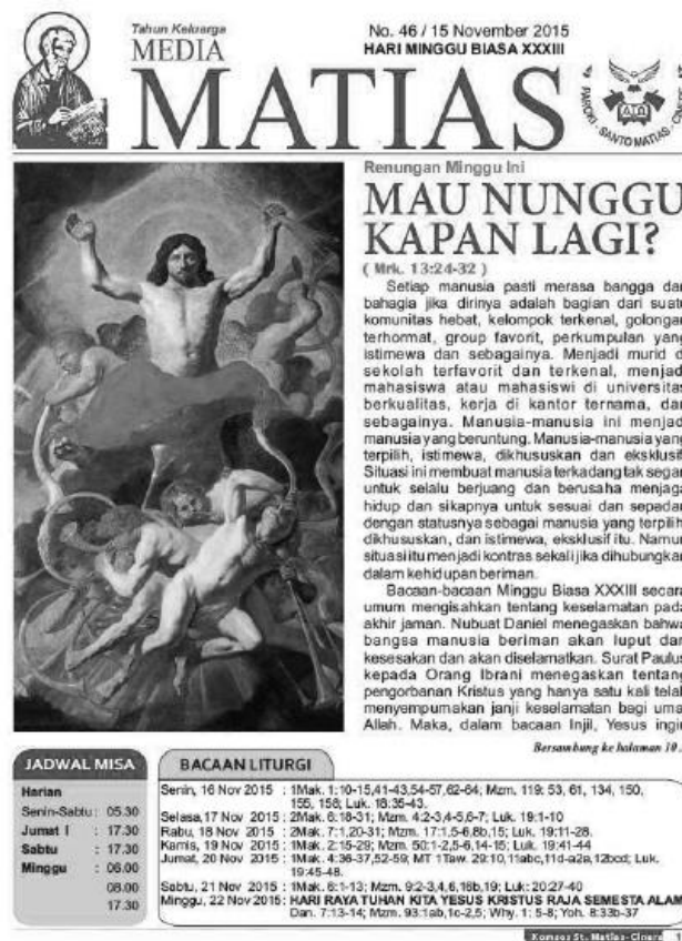
Gambar I.1. Halaman 1 Media Matias

Gambar berikut ini merupakan contoh tampilan konten dari Media Matias edisi 15 November 2015