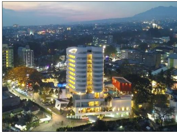
Gambar 1.1 Foto Udara Sensa Hotel Bandung

menyerupai kupu-kupu serta adanya kamar yang berbentuk setengah lingkaran, menjadi salah satu daya tarik dari hotel ini, selain karena memang lokasinya yang strategis.