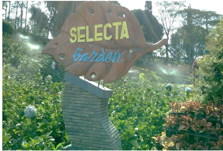
Gambar 1.1 Taman Bunga Selecta