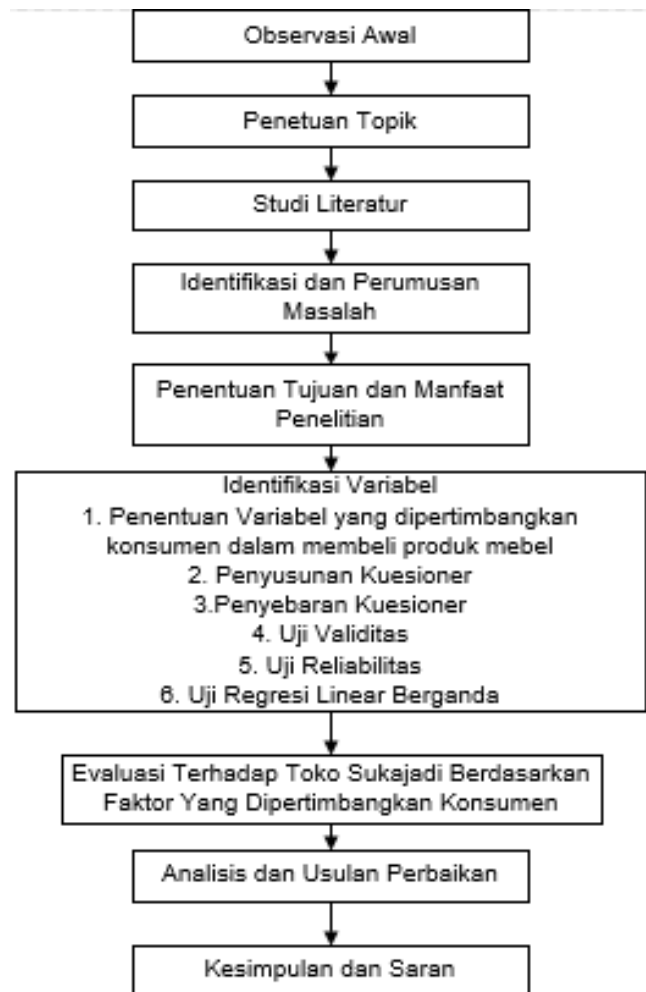
Gambar I.2 Metodologi Penelitian

Selain tahapan metodologi penelitian yang digambarkan dengan diagram alir, terdapat penjelasan mengenai tahapan tersebut. Tahapan pada Gambar I.2 dapat dipaparkan dan dilihat sebagai berikut: