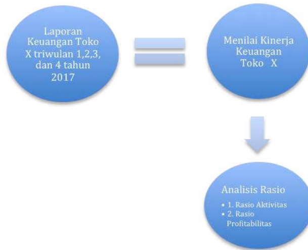
Gambar 1. 2 Kerangka Pemikiran

Dalam menyusun makalah ini, penulis mengumpulkan informasi mengenai proses bisnis yang dilakukan oleh pemilik dalam menjalankan bisnisnya selama ini dan mengumpulkan semua catatan keuangan yang dimiliki oleh pemilik. Setelah mengetahui proses bisnis dan mendapat catatan maupun data-data yang dibutuhkan, penulis kemudian menyusun laporan keuangan berupa laporan laba rugi dan neraca berdasarkan data yang didapat dari pemilik Toko MG. Setelah Laporan Laba Rugi dan Neraca selesai dibuat, penulis akan menganalisis kinerja laporan keuangan perusahaan selama 1 tahun dengan menggunakan analisis rasio, yang terdiri dari rasio profitabilitas, dimana penulis ingin membahas tentang kemampuan Toko MG dalam menghasilkan profit atau laba bagi pemilik Toko tersebut. Dalam analisis ini ada tiga rasio profitabilitas yang diukur, yaitu margin laba kotor, margin laba operasional, dan margin laba bersih. Dan yang kedua adalah rasio aktivitas dimana peneliti ingin membahas tentang seberapa efisien dan efektif perusahaan dalam mengelola aset yang dimiliki. Dalam analisis ini ada tiga rasio aktivitas yang diukur, yaitu perputaran persediaan, perputaran aktiva tetap, dan perputaran total aktiva. Setelah menganalisis laporan keuangan tersebut maka akan dapat diketahui bagaimana perkembangan kinerja keuangan Toko MG triwulan I, II, III dan IV selama tahun 2017 setelah dibuatnya laporan keuangan.