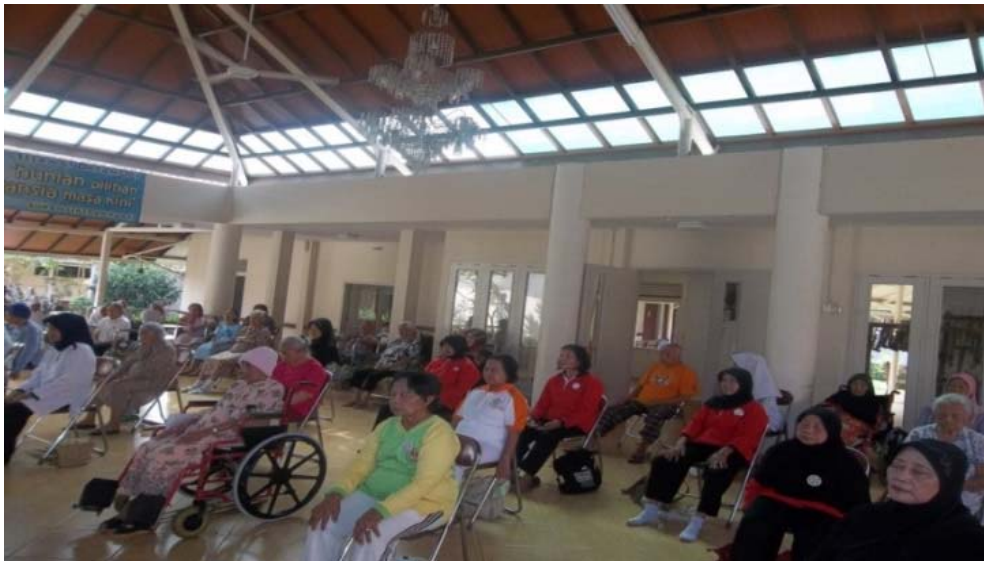
Gambar 1.3. Suasana Rumah Jompo Tresna Werdha Karya Bhakti

Penelitian diawali dengan melakukan wawancara dengan 6 orang lansia. Responden terdiri dari 2 orang pria dan 4 orang wanita yang berusia antara 64-90 tahun. Wawancara dilakukan terhadap kaum lansia yang tinggal di Sasana Tresna Werdha Karya Bhakti Cibubur. Adapun suasana Sasana Werdha Karya Bhakti dapat dilihat pada Gambar 1.3.