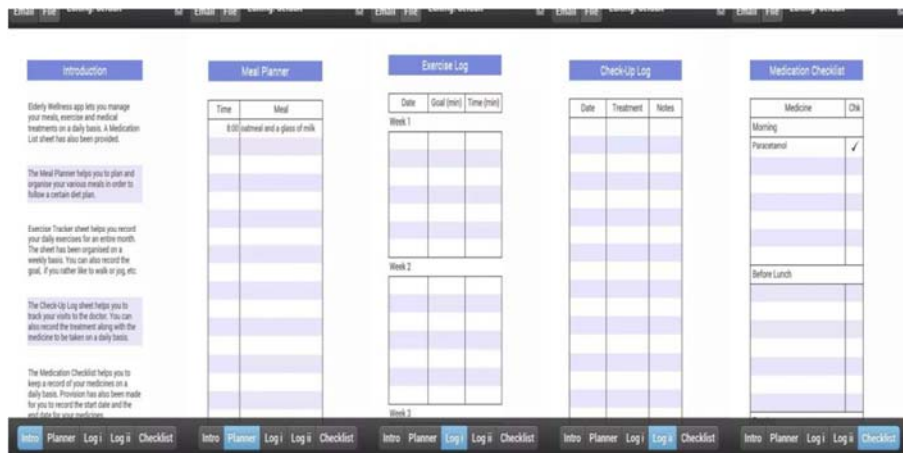
Gambar I.2. Screenshot Aplikasi Elderly Care (ASPIRING USER APPS)

Elderly Care merupakan suatu aplikasi yang ditujukan untuk kalangan lanjut usia. Aplikasi ini berguna untuk membantu mereka menjaga kesehatan, mengatur jadwal makan, dan jadwal perawatan medis. Aplikasi ini memiliki beberapa fitur, diantaranya weekly meal planner , exercise tracker , checkup log sheet , dan medication checklist . Selain itu, terdapat fitur print dan juga e-mail untuk pengguna membagi lognya ke pengguna lain. Aplikasi ini memiliki kelebihan yaitu bentuk aplikasi yang cukup sederhana sehingga lebih mudah untuk dimengerti dan digunakan oleh lansia. Selain itu tulisan yang terdapat pada aplikasi ini juga tidak terlalu kecil sehingga cukup jelas untuk dilihat. Kekurangan dari aplikasi ini adalah penjelasan serta fitur-fitur yang terdapat pada aplikasi masih dalam Bahasa Inggris, sehingga mungkin sulit dimengerti bagi kaum lansia yang tinggal di Indonesia. Tampilan dari Elderly Care dapat dilihat pada Gambar I.2.