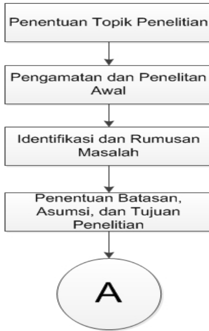
Gambar I.1 Metodologi Penelitian

Metodologi penelitian yang dilakukan penelitian ini dapat dilihat pada diagram aliran pada Gambar I.1.