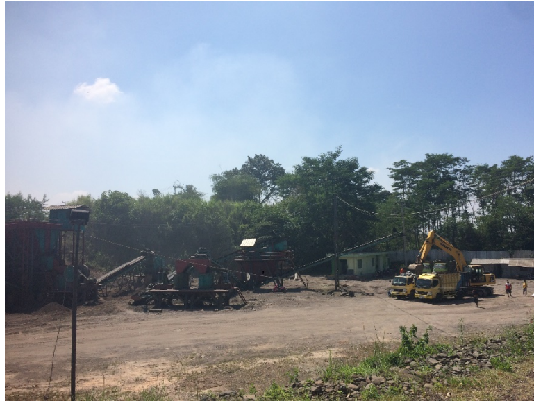
Gambar 1. 1 LAPANGAN PRODUKSI PT. REGA DAN REFALDI PERKASA