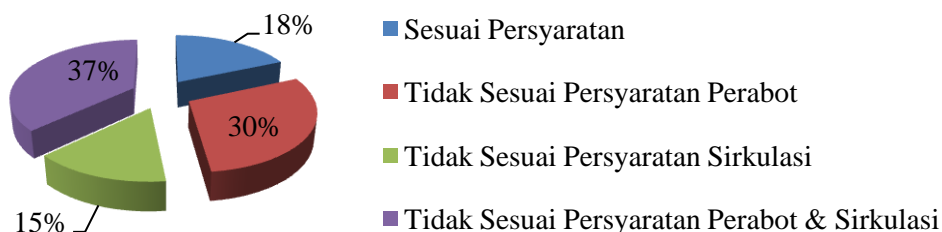
Gambar 6.2 Presentase Hasil Analisis Kebutuhan Ruang Unit Meizi dan Ibu Nia

Pada unit Meizi dan Ibu Nia, presentase analisa berdasarkan kebutuhan ruang dapat dilihat pada gambar 6.2. Dari gambar terlihat bahwa sebagian besar ruang belum memenuhi persyaratan perabot & sirkulasi. Hanya sedikit ruang yang memenuhi kebutuhan ruang.