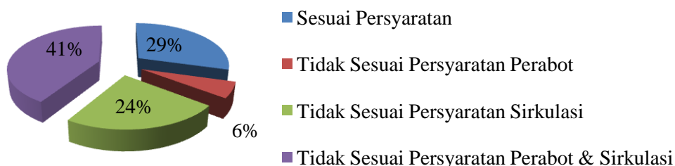
Gambar 6.3 Presentase Hasil Analisis Kebutuhan Ruang Unit Sinar Persada dan Pak Suhandra

Berdasarkan persyaratan perabot dan sirkulasi untuk memenuhi kebutuhan ruang, hasil analisa pada unit Sinar Persada dan Pak Suhandra dapat dilihat pada gambar 6.3. Dari gambar terlihat bahwa sebagian besar ruang belum memenuhi persyaratan perabot & sirkulasi.