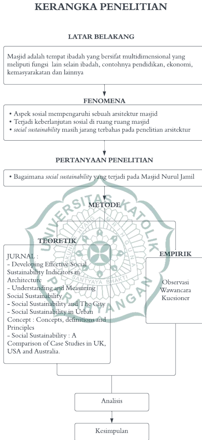
Gambar 1.1 Kerangka Penelitian