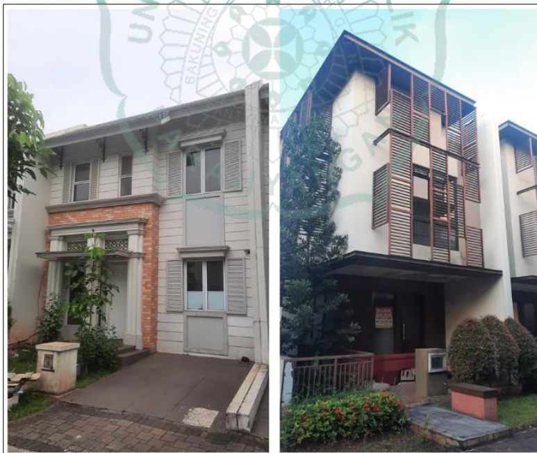
Gambar 1.2 Rumah di Cluster Hylands (kiri) dan Cluster Whelford (kanan)

Dari 9 cluster perumahan di Greenwich Park, terdapat 2 cluster yang memiliki satu gerbang yang sama yaitu Cluster Hylands dan Cluster Whelford. Menurut Feng Shui, pintu gerbang berperan sebagai “mulut” suatu kawasan, sehingga ketika terdapat 2 cluster yang memiliki pintu gerbang yang sama seharusnya kondisi yang terdapat di kedua cluster tersebut juga kurang lebih sama. Setelah beberapa pengamatan, Cluster Hylands malah cenderung lebih banyak diminati dibandingkan Cluster Whelford karena jumlah rumah yang berpenghuni lebih banyak dibandingkan Cluster Whelford dan terkesan lebih hidup. Seperti yang telah dibahas sebelumnya, seharusnya kondisi kedua cluster tersebut kurang lebih sama karena memiliki “mulut” yang sama.