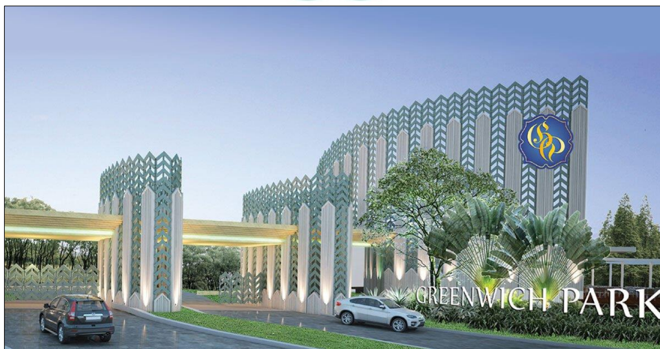
Gambar 1.1 Greenwich Park BSD

Salah satu kawasan perumahan yang dikembangkan oleh Sinar Mas Land adalah kompleks perumahan Greenwich Park yang berlokasi di BSD City, yang merupakan kota mandiri terencana milik Sinar Mas Land. Kompleks perumahan Greenwich Park BSD memiliki luas 47 hektar dengan 9 cluster di dalamnya, dan memiliki konsep berupa resort. Kawasan ini bersifat private sehingga hanya orang yang berkepentingan yang boleh memasuki kawasan perumahan ini. Kompleks perumahan ini berlokasi di perbatasan antara kawasan Gading Serpong dan juga BSD sehingga mudah untuk menjangkau fasilitas-fasilitas yang berada di kedua kawasan tersebut.