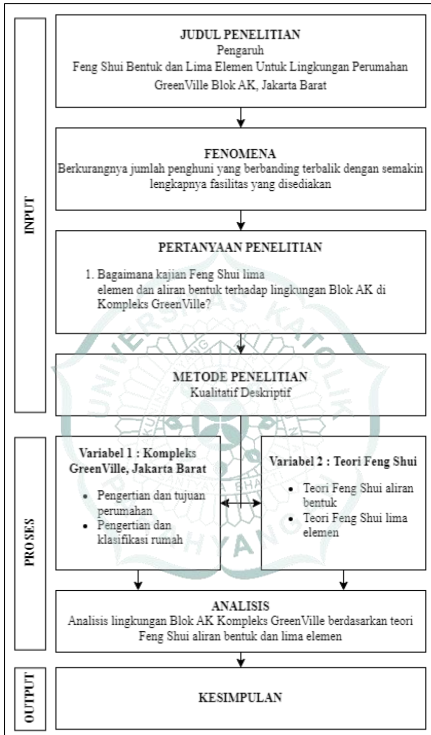
Gambar 1.1 Diagram Kerangka Penelitian