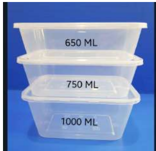
Gambar 1.3 Kotak Makan Plastik