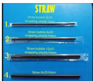
Gambar 1.5 Sedotan