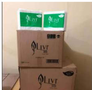
Gambar 1.4 Tisu