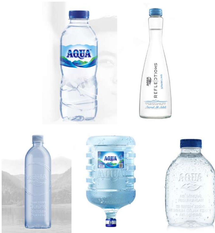
Gambar 2. Produk-produk AQUA