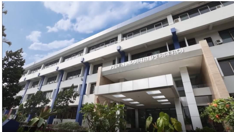
GAMBAR 1.2. KANTOR PT. LEN INDUSTRI (PERSERO)