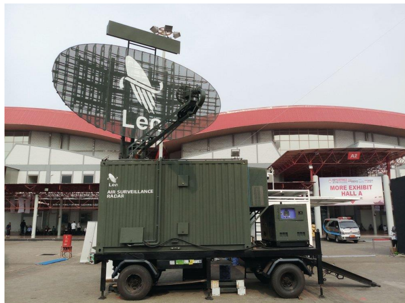
GAMBAR 1.4. RADAR AIR SUVEILLANCEI LEN S-200

Pada gambar 1.4. penulis melampirkan gambar salah satu alat yaitu Radar Air Surveillance Len S-200