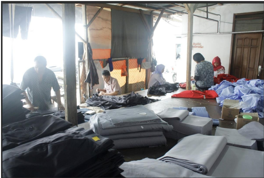
Gambar I.1 UMKM X

UMKM X adalah usaha yang bergerak di bidang industri garmen. Adapun produksi yang dilakukan oleh UMKM X adalah pembuatan baju lengan panjang, baju lengan pendek, almamater, seragam pabrik, dan kemeja, namun produksi yang paling sering dilakukan adalah pembuatan kemeja dan seragam pabrik. UMKM yang berdiri sejak tahun 1988 ini terletak di Lembang, Jawa Barat dan memiliki karyawan sebanyak 85 orang. UMKM ini beroperasi pada hari Senin-Sabtu pukul 8.00-16.00 WIB, namun jika terdapat pesanan yang harus segera diselesaikan maka memungkinkan untuk menambah jam kerja selama 2 jam di hari tersebut atau melakukan produksi pada hari Minggu jam 9.00-14.00 WIB. Model produksi yang ada di UMKM ini adalah make to order , yaitu memproduksi baju atau seragam yang dipesan oleh konsumen.