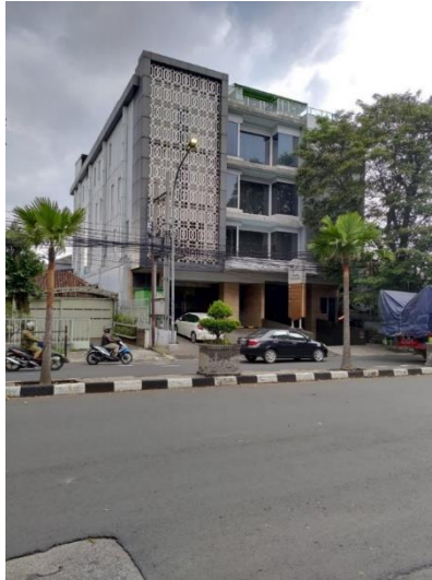
Gambar I.2 Hotel Grand Vivieana Bandung

(Sumber: Data Persentase Tingkat Hunian Hotel Dinas Kebudayaan dan Pariwisata Kota Bandung)