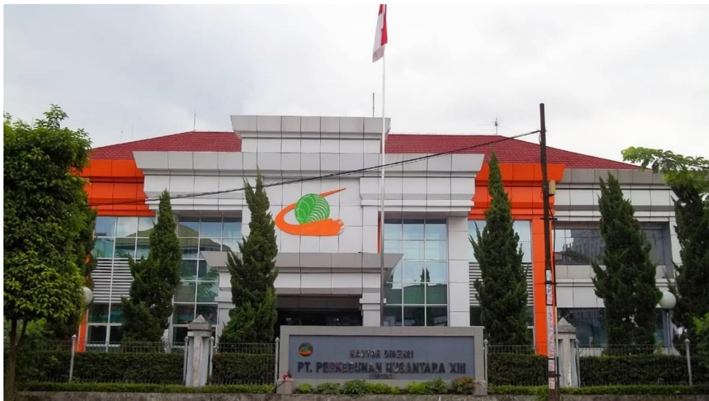
Gambar 1.1 PT Perkebunan Nusantara XIII

PT Perkebunan Nusantara XIII atau PTPN XIII merupakan sebuah perusahaan berbentuk badan hukum Perseroan Terbatas (PT) yang bergerak di bidang pertanian terutama bagian kelapa sawit dan karet. PTPN XIII mengawali perjalanannya pada tahun 1996. Perusahaan yang merupakan satu-satunya BUMN perkebunan di wilayah Kalimantan ini adalah hasil penggabungan dari Proyek Pengembangan 8 PTP yaitu PTP VI, PTP VII, XIII, XVIII, XXIV-V, XXVI dan XXIX yang tersebar di seluruh wilayah Indonesia. Kantor Direksi PT Perkebunan Nusantara XIII terletak di Jl. Sultan Abdurrahman No.11, Sungai Bangkong, Kec. Pontianak Kota, Kota Pontianak, Kalimantan Barat. PT Perkebunan Nusantara XIII sendiri memiliki 40 unit kebun dan pabrik kelapa sawit maupun karet yang tersebar di seluruh wilayah Kalimantan. PT Perkebunan Nusantara XIII memiliki visi dan misi sebagai berikut: