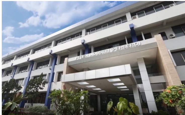
GAMBAR 1. 2. KANTOR PT Len Industri BANDUNG