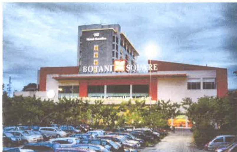
Gambar 1. 2. Perspektif Mall Botani Square, Bogor

Sebagai sebuah mal, Botani Square menawarkan konsep baru kepada pengunjung, yaitu menggunakan sistem square dan menjadi yang pertama di Kota Bogor. Mal ini dibuka sejak pertengahan 2006 dan memiliki luas sekitar 42.000 m 2 . Mal ini berada di akses pintu masuk atau keluar Jalan Tol Jagorawi dan dekat dengan Pool Bus DAMRI. Selain itu mal ini terintegrasi dengan Hotel Santika, IPB Convention Hotel , dan IPB International Convention Center yang biasa digunakan sebagai tempat penyelenggaraan seminar baik nasional maupun internasional. Maka dari itu diketahui bahwa Mall Botani Square berada pada lokasi yang strategis.