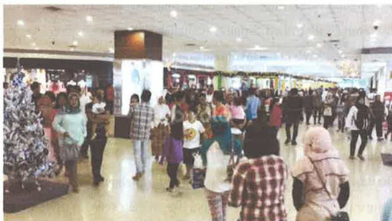
Gambar 1. 3 Suasana Mall Botani Square Bogor

Fenomena lain yaitu tingkat keramaian pengunjung pada tiap lantai mal berbeda-beda padahal tata letak unit di dalam Mall Botani Square secara arsitektur terlihat tipikal pada tiap lantai dan jenis barang-barang yang dijual di tenant-tenant yang ada tidak jauh berbeda antara lantai satu dengan lantai lainnya, bahkan ada beberapa tenant yang masih belum laku terjual pada lantai tertentu. Selain perbedaan pada tiap lantai, keramaian pengunjung pada tiap area di satu lantai juga tidak merata. Pengunjung terkonsentrasi pada tenant-tenant di area tengah dan ujung mal, sedangkan tenant-tenant yang berada di sepanjang jalur sirkulasi terlihat sepi pengunjung.