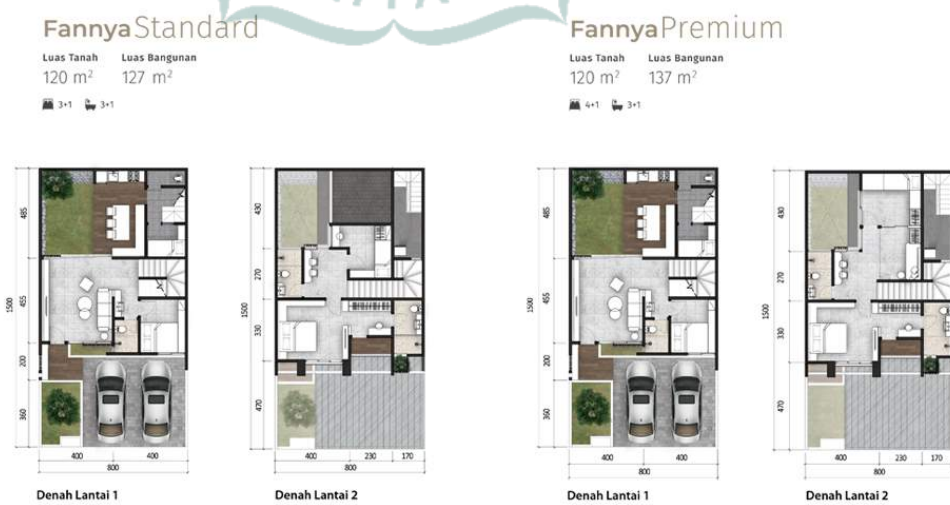
Gambar 1.7. Denah Cluster Flora Tipe Fannya Standard dan Fannya Premium