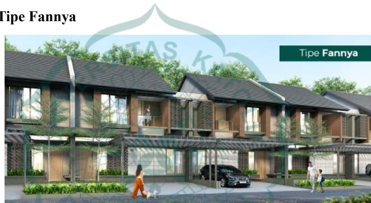
Gambar 1.6. Cluster Flora Tipe Fannya