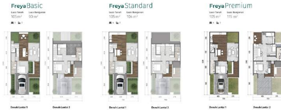
Gambar 1.5. Denah Cluster Flora Tipe Freya Basic, Freya Standard, dan Freya Premium