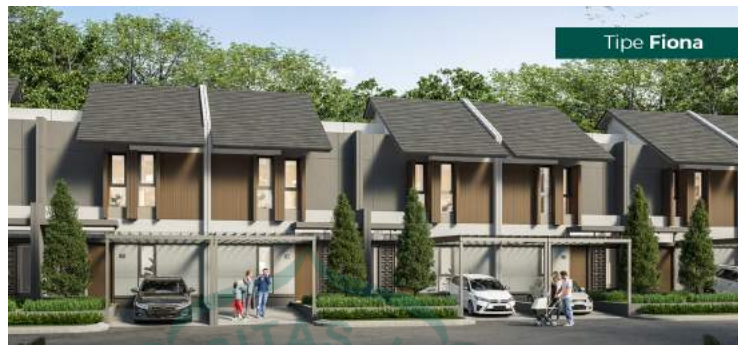
Gambar 1.2. Cluster Flora Tipe Fiona