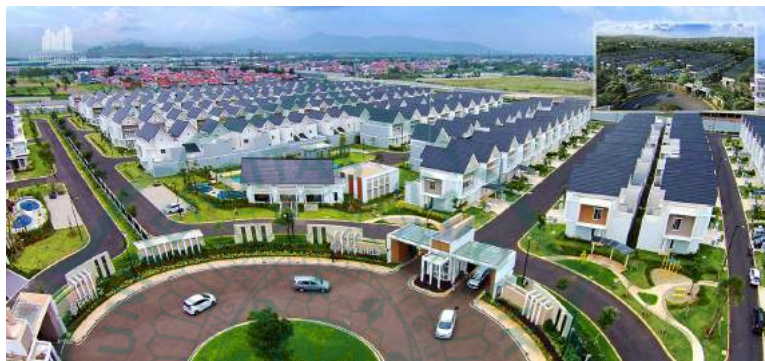
Gambar 1.1. Perumahan Summarecon Bandung

asri karena perumahan cluster biasanya menitikberatkan area hijau sebagai salah satu aspek rancangannya dibandingkan dengan kompleks perumahan biasa. Sementara untuk preferensi gaya desain rumah, generasi milenial cenderung menyukai hunian bergaya minimalis-tropis dengan luas hunian 70 meter persegi yang mencakup 3 kamar tidur, 2 kamar mandi, dapur, serta ruang keluarga, dengan ruang sekunder yang terdiri atas ruang tamu, ruang cuci pakaian dan jemuran, ruang makan, dan carport . Dampak dari pola pikir ini pun terlihat pada maraknya pembangunan perumahan cluster , salah satunya yaitu Summarecon Bandung.