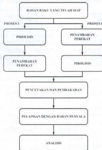
Gambar 2. Skema pembuatan biobriket

Sebelum digunakan, blotong mengalami perlakuan awal yang bertujuan untuk membersihkan blotong dari pengotor, membuat ukuran blotong seragam, dan pengeringan blotong sebelum memasuki tahap berikutnya. Pencucian blotong pada perlakuan awal ini dilakukan dengan menggunakan air. Setelah dicuci, blotong dikeringkan pada temperatur 105 °C, 117,5 °C, dan 130°C selama 24 jam agar kandungan air menguap dan blotong kering. Apabila blotong yang digunakan telah kering karena terkena sinar matahari di tempat penimbunannya di pabrik, maka proses berikutnya langsung menyamakan ukuran blotong tanpa perlu dicuci. Blotong ditumbuk dan diayak dengan mesh -30+40 agar blotong memiliki ukuran yang seragam. Blotong yang telah kering dan homogen tersebut kemudian disimpan dalam eksikator untuk digunakan kemudian digunakan pada penelitian pendahuluan, dan penelitian utama. Skema pembuatan biobriket dapat dilihat pada Gambar 2.