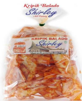
Gambar 1. 1 Produk Kripik Balado Shirley