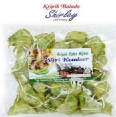
Gambar 1. 3 Produk Kripik Balado Shirley