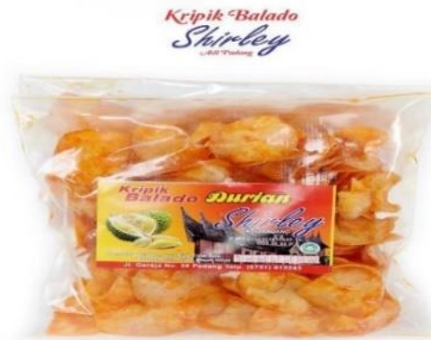
Gambar 1. 2 Produk Kripik Balado Shirley

Kripik balado durian merupakan inovasi atau pengembangan produk dari Kripik Balado Shirley.