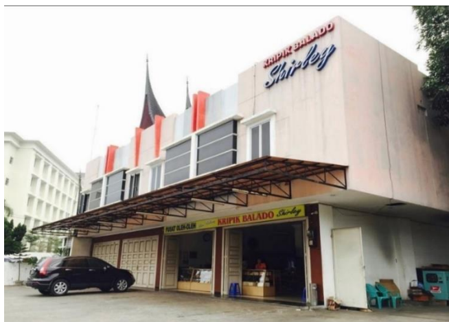
Gambar 1. 1 Gedung Toko Kripik Balado Shirley

Lokasi penelitian dilakukan di toko Kripik Balado Shirley yang berada di jalan Gereja no 65 A, Kota Padang, Sumatera Barat. Lokasi yang ada cukup luas serta cukup strategi sehingga mudah untuk dijangkau oleh konsumen.