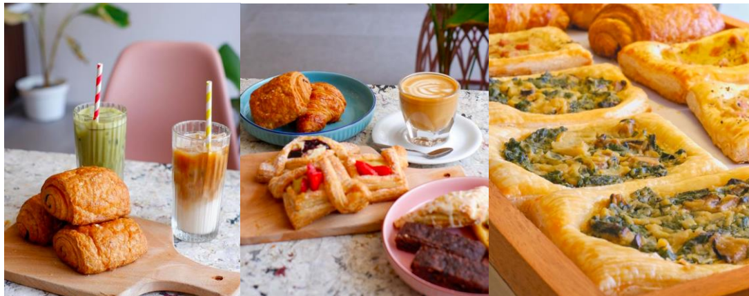
Gambar 1. 1 Menu Makanan