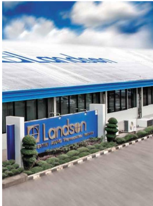
Gambar 1.1 Tampilan Landson Pertiwi Agung

Landson PT Pertiwi Agung adalah salah satu anak perusahaan dari Mensa Group. Perusahaan ini telah berdiri sejak tahun 1966 dan diakuisisi oleh Mensa Group pada tahun 1984. Perusahaan ini tidak memiliki kantor cabang ataupun pabrik cabang.