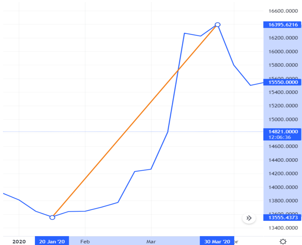
Gambar 3 Grafik pergerakan kurs Rupiah Indonesia terhadap Dolar Amerika periode 20 Januari 2020 – 30 maret 2020