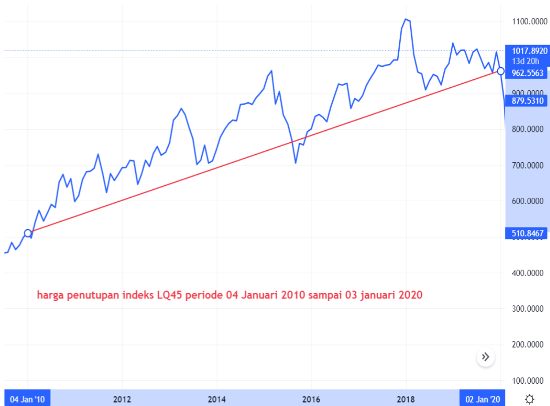
Gambar 2 Grafik pergerakan harga indeks saham LQ45 periode 4 Januari 2010 – 02 Januari 2020.