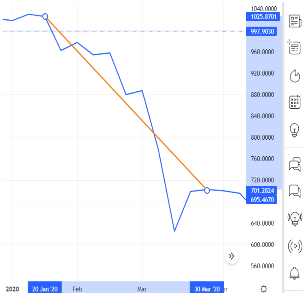
Gambar 4 Grafik Pergerakan harga indeks saham LQ45 periode 20 Januari 2020 – 30 Maret 2020