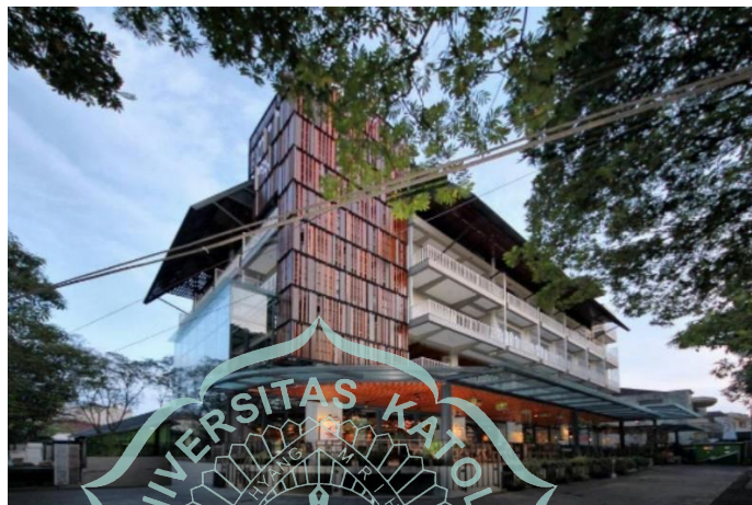
Gambar 1.1 Tampak Depan Hotel Hay

menikmati fasilitas outdoor. Cafe bisa menampung hingga kurang lebih 120 pengunjung , tapi mengingat saat ini dengan masa pandemic , maka jumlah pengunjung café yang diperbolehkan makan ditempat atau dine in menjadi dibatasi. Keberadaan café ini menjadi sebuah keuntungan untuk hotel karena keberadaan café bisa merangkap fungsi restoran yang menyediakan makanan bagi tamu hotel dan bisa sebagai tempat berkumpul. Tapi kenyataannya pengunjung yang datang bukanlah penghuni hotel.