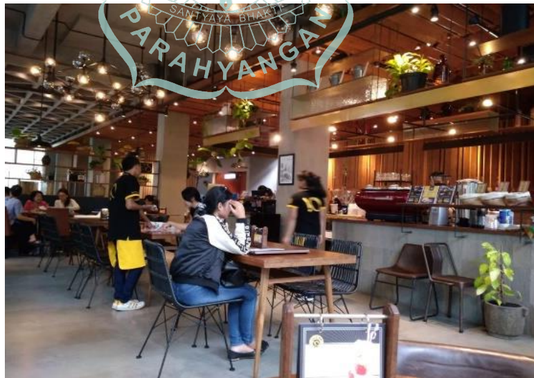
Gambar 1. 1 Keadaan Cafe

Salah satu Hotel bintang 3 yang ada di Bandung adalah Hay Hotel di jalan Trunojoyo. Kawasan disekitar hotel berdiri berbagai restoran dan café yang menjadikan posisi hotel cukup strategis. Hotel ini memiliki café My kopi O yang berada di lantai dasar dan menyatu dengan lobby hotel. Hal ini menjadi sebuah keuntungan untuk hotel karena keberadaan café bisa merangkap fungsi restoran yang menyediakan makanan bagi tamu hotel.