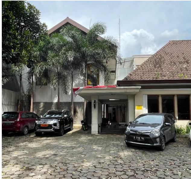
Gambar 1.3 Gambar Hotel Frances

Kasus studi lain yang dipilih adalah Hotel Frances yang terletak di jalan Cipaganti. Hotel Frances terletak di jalan Cipaganti, terdiri dari 36 kamar dengan 4 tipe kamar yang berbeda. Berbeda dengan Hay hotel, kamar pada hotel Frances memiliki layout dan ukuran yang berbeda. Di jalan Cipaganti terdapat bangunan hotel sejenis yaitu hotel Puri Indah. Bangunan hotel Frances sudah berdiri sejak lama dan menurut hasil wawancara dengan owner yang sekarang memegang hotel ini, dulunya bangunan hotel ini dimiliki oleh keluarga besar Ani Yuhdoyono sebelum pada tahun 2014 diambil oleh owner yang sekarang.