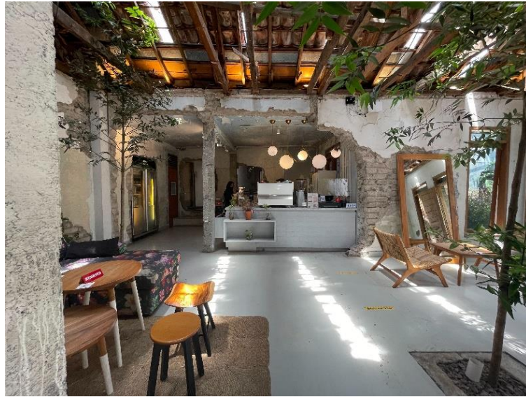
Gambar 1.2 Gambar Café SamaDengan

Di area belakang hotel juga terdapat Café SamaDengan yang memakai bangunan eksisting yang sebelumnya merupakan bangunan mess karyawan. Saat survey ke café , jumlah pengunjung café tidaklah ramai, berbeda jauh dengan café di Hay Hotel. Café memiliki desain yang unik karena menggunakan bangunan eksisting yang tampak terbengkalai sebagai café tanpa mengubah banyak elemen bangunan sebelumnya.