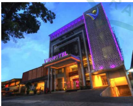
Gambar 1.1 Vio Hotel Cihampelas

Vio Hotel merupakan salah satu hotel yang cukup terkenal di Kota Bandung. Vio Hotel ini memiliki enam cabang yaitu di daerah Pasteur, Surapati, Westhoff, Cimanuk, Veteran dan Cihampelas. Vio Pasteur merupakan salah satu cabang Vio yang terdekat dengan akses masuk turis melalui gerbang tol Pasteur dan Vio Cihampelas merupakan salah satu cabang yang dekat dengan daerah turis dimana Cihampelas dikenal sebagai area perbelanjaan.