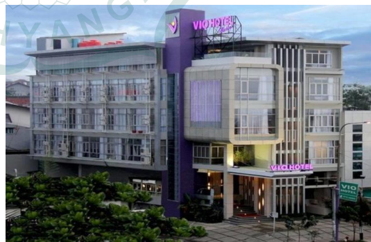
Gambar 1.2 Vio Hotel Pasteur

Objek penelitian yang akan digunakan adalah Vio Hotel yang terletak pada cabang Pasteur dan Cihampelas. Meskipun kedua cabang tersebut berada di area turis yang ramai namun terdapat perbedaan tingkat occupancy rate antara kedua cabang tersebut. Diketahui