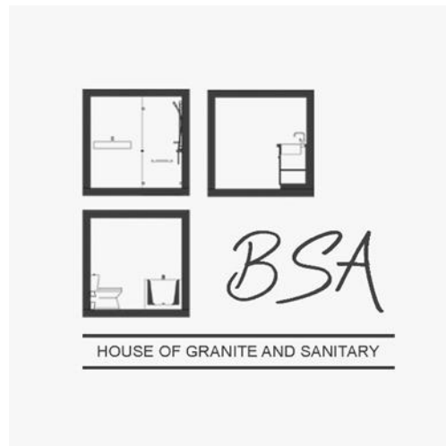
Gambar 1.0.2 Logo Perusahaan