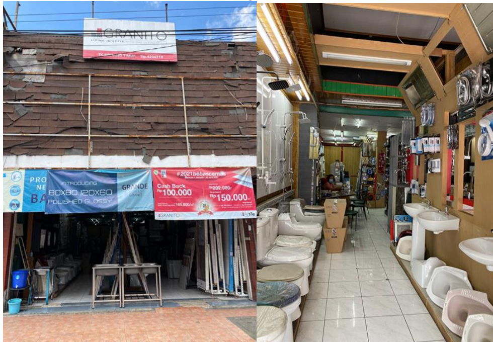
Gambar 1.4 Toko Bangunan Sentosa Abadi di Jalan Otista