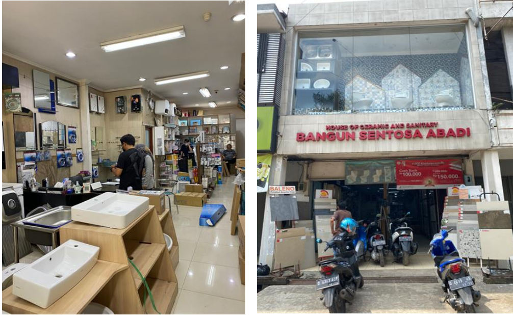
Gambar 1.3 Toko Bangunan Sentosa Abadi di Jalan Holis