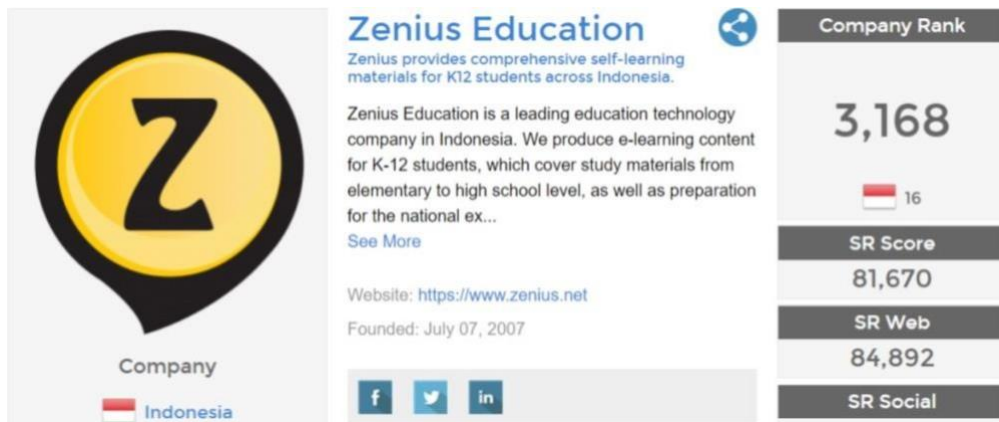
Gambar 1.4 Company Rank Zenius