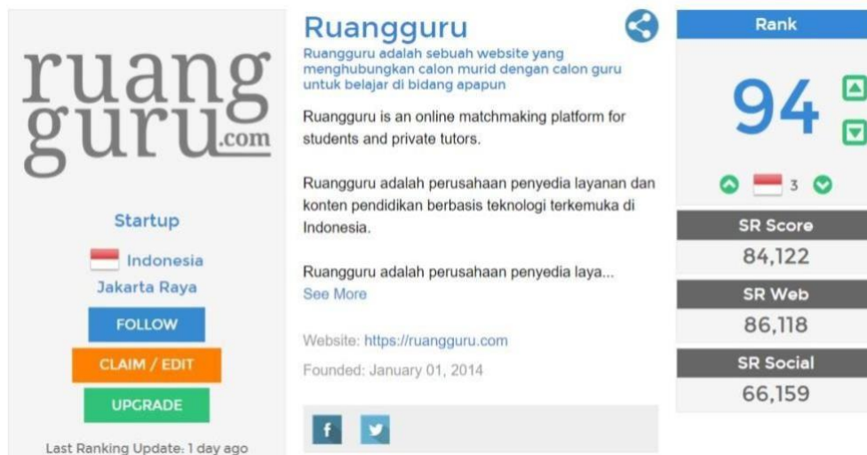
Company Rank Ruangguru