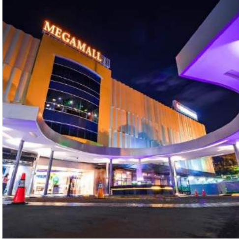
Gambar 1.1. Mega Mall Batam Centre