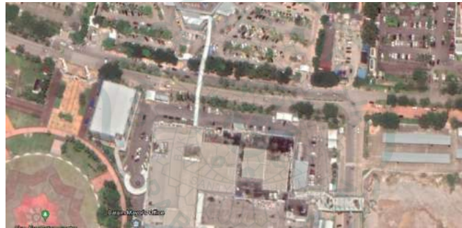
Gambar 1.2 Lokasi Mega Mall Batam Centre

Fenomena yang akan dibahas pada penelitian ini merupakan tingkat keramaian yang berbeda-beda pada tiap zonasi area mall. Mall ini terdiri dari 5 lantai, yaitu lantai dasar, lantai lower ground , lantai upper ground , lantai 1, dan lantai 2. Mall ini cukup ramai tapi hanya pada lantai dasar saja dan beberapa zona tertentu, pada lantai-lantai berikutnya pengunjung semakin sepi. Penulis ingin menganalisis ketidakmerataan tingkat keramaian pada zonasi-zonasi mall menggunakan Teori Feng Shui khususnya teori air untuk mengetahui energi chi yang mengalir pada tiap ritel.