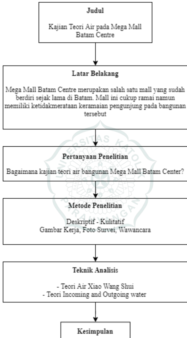
Gambar 1.3 Kerangka Penelitian