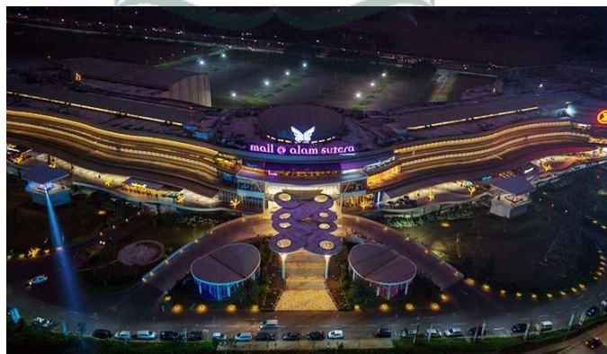
Gambar 1.1. Ekterior Mall @ Alam Sutera

Mall @ Alam Sutera merupakan sebuah mall yang berada di Perumahan Alam Sutera. Mall ini berdiri pada tahun 2012 namun dapat dirasakan beberapa tahun terakhir mall ini menjadi sepi. Padahal Mall @ Alam Sutera memiliki fasilitas dan tenant-tenant yang cukup banyak untuk mengundang pengunjung. Mall @ Alam Sutera awalnya menggandeng beberapa tenant besar seperti Cinema XXI, Gramedia, SOGO, dan masih banyak lagi. Namun, seiring berjalannya waktu tenant-tenant tersebut semakin banyak yang tutup dan menjadi sepi. Lokasi dari Mall @ Alam Sutera ini juga cukup strategis karena terletak dekat dengan akses Tol Jakarta-Tangerang dan berada di Perumahan Alam Sutera yang cukup ramai ditinggali.