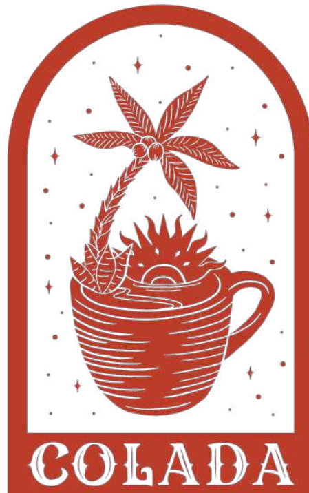
Gambar 1.I.2 Logo Perusahaan