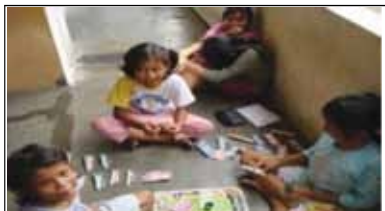
Gambar 14 : Ilustrasi pengawasan dari balik jendela dan kegiatan penghuni di depan unit rumah susun ( natural surveillance ).

Pada rumah susun sederhana, kebiasaan penghuni membuka pintu lebar-lebar pada pagi hari untuk mendapatkan sirkulasi udara yang baik, sekaligus memberikan kesempatan pengawasan alami ( secara visual ), dengan melihat ke arah tempat-tempat umum/publik dan semi publik ( selasar/koridor ). Kegiatan ini dilakukan sebagai bagian dari kegiatan penghuni sehari-hari dari dalam ruangan sambil beraktivitas, misalnya: ibu-ibu sambil memasak di dapur atau bapak - bapak duduk sambil membaca koran dan menonton televisi, anak-anak bermain di depan pintu unit rumah susun, sehingga menghindari terjadinya blind spot area .