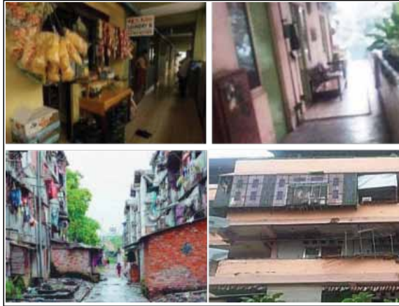
Gambar 8 : Contoh Invasi/Agresi Fisik Terhadap Teritori Publik.