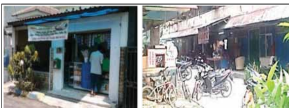
Gambar 9 : Contoh Invasi/Agresi Psikologis Terhadap Teritori Publik