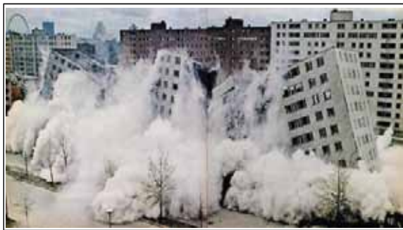
Gambar 2. Pruitt Igoe, Amerika Serikat. bangunan Bijlmermeer, Belanda.

dengan identitas teritori yang jelas cenderung lebih rawan terhadap perampokan, terutama rumah yang tidak memiliki pagar, garasi, dan rumah yang letaknya berjauhan dengan rumah lainnya.