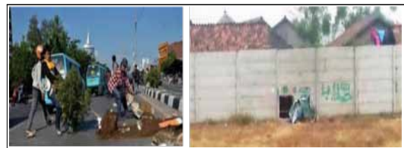
Gambar 11 : Contoh Kekerasan Terhadap Teritorialitas Terhadap Teritori Publik