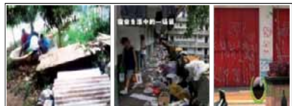
Gambar 12 : Contoh Perlakuan Kontaminasi Terhadap Teritori Privat Atau Publik