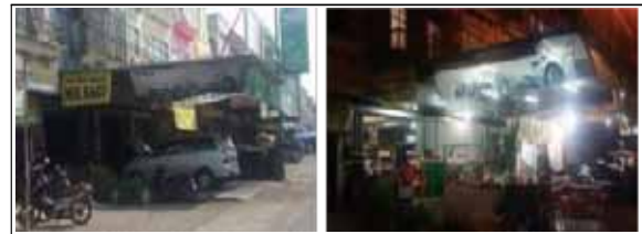
Gambar 10 : Contoh Waktu Penggunaan Teritorial

mi-salnya: gangguan atau kerusakan terhadap fasili-tas publik, dan sebagainya.