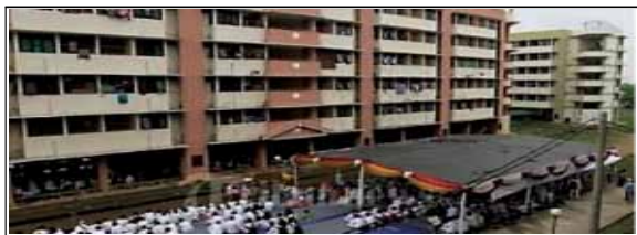
Gambar 13 : Contoh Ruang Publik Untuk Kepentingan Pribadi Atau Bersama

bersama-sama, karena sudah terbentuknya budaya pola kehidupan sosial yang baik, seperti: saling menghargai, gotong-royong, tolong-menolong dan sebagainya.