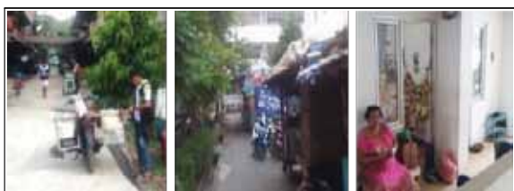
Gambar 6 : Masuknya Pedagang Asongan, Kaki Lima dan Kios Dalam Area Rumah Susun

Kondisi rumah susun sederhana yang “terbuka” ini, membuat tingkat kerawanan akan gangguan keamanan yang tinggi, karena akan mengundang warga di luar penghuni rumah susun untuk datang dan melakukan kegiatan di kawasan rumah susun. Hal ini juga mengakibatkan terbukanya peluang terjadinya kegiatan kriminal, seperti: pencurian