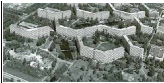
Gambar 1. Bangunan Bijlmermeer, Belanda.