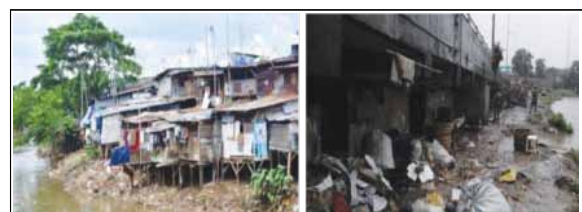
Gambar 3. Contoh Penghuni Liar Di Pinggir Kali Atau Di Bawah Jembatan

Teritorialitas merupakan suatu pola tingkah laku manusia yang berhubungan dengan kepemilikan atau hak yang dikuasai/dimiliki dan di-