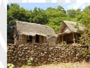
LAKHOUN, RUMAH LAKI-LAKI