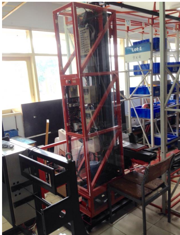
Gambar I.1 AS/RS Laboratorium Otomasi Sistem Produksi

AS/RS merupakan salah satu alternatif solusi sistem terotomasi yang dapat diterapkan perusahaan untuk mengoptimalkan proses pada bagian storage dan warehouse . Sistem AS/RS ini bekerja secara otomatis mengambil maupun meletakkan komponen yang diinginkan pada rak yang sudah ditentukan. Hal tersebut dikarenakan fungsi utama AS/RS yakni memperkecil waktu serta memperkecil adanya kesalahan saat proses berlangsung.