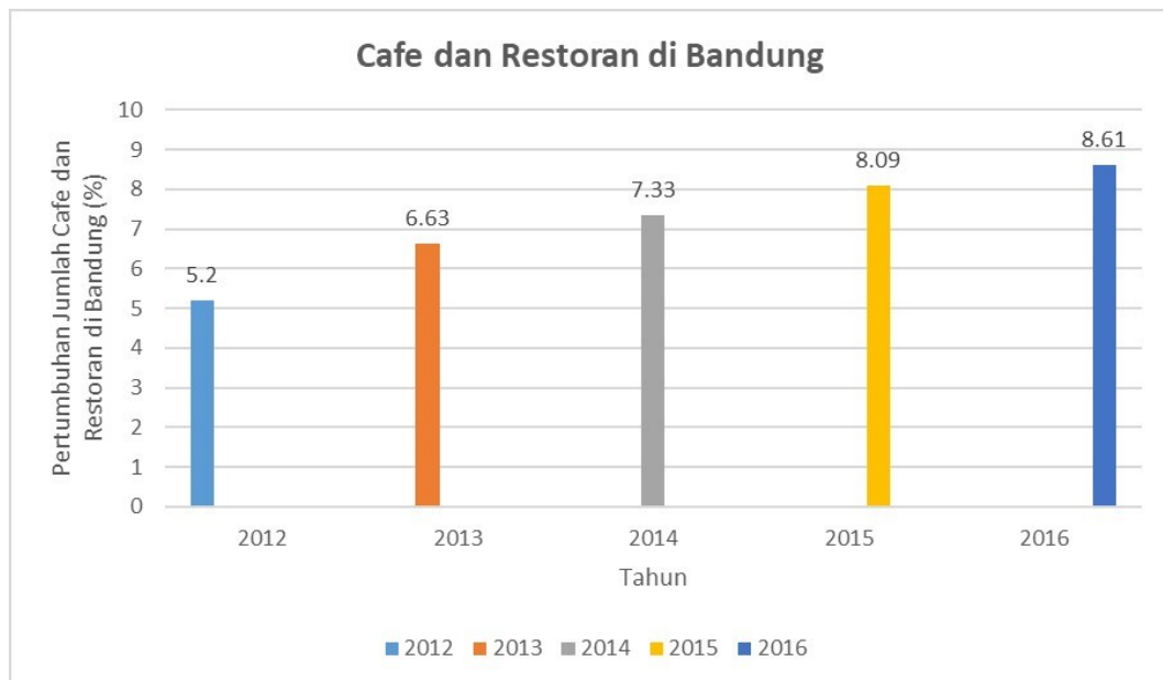
Gambar 1.1 Perkembangan Cafe dan Restoran di Bandung

Gambar diatas memaparkan bahwa pertumbuhan jumlah restoran dan café di kota Bandung tergolong mengalami peningkatan.