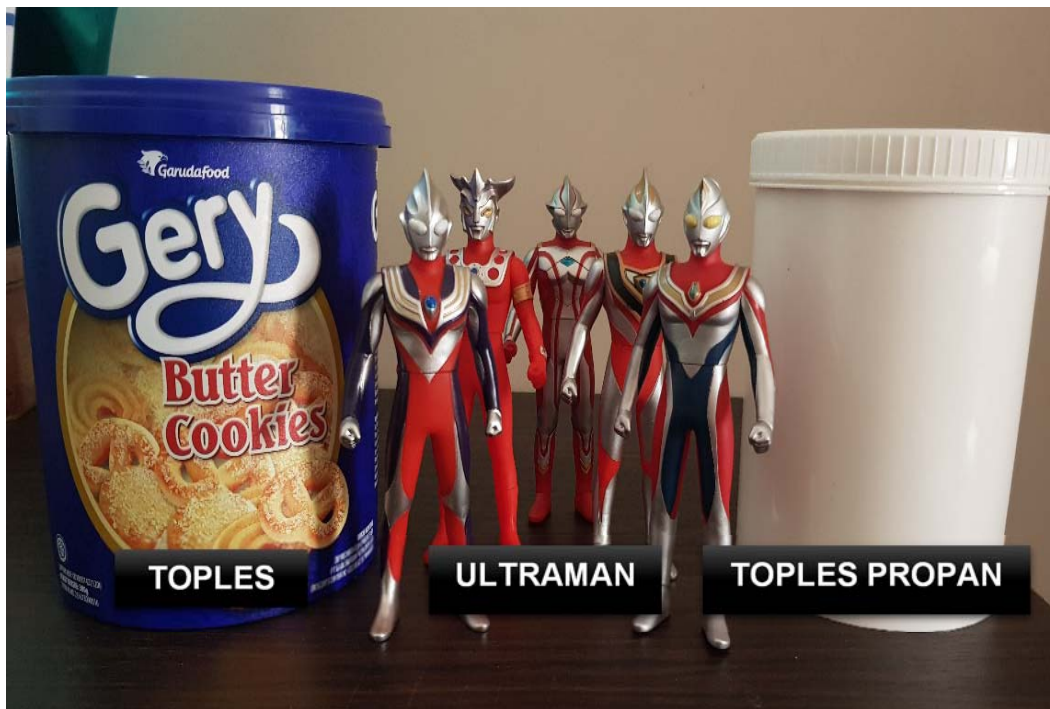
Gambar I.1. Produk Unggulan yang Diproduksi Kontinu

terfokus pada satu produk saja. Penelitian difokuskan hanya pada satu produk saja dengan tujuan agar hasil penelitian lebih komprehensif dan terfokus. Gambar I.1 menunjukkan ketiga produk unggulan yang diproduksi secara kontinu.